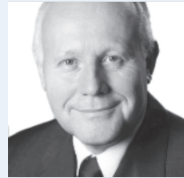
Prof. Dr. Georg Milbradt, Ministerpräsident a.D.

Prof. Dr. Georg Milbradt war von 2002 bis 2008 Ministerpräsident des Freistaates Sachsen. Von 1983 bis 1990 war er Finanzdezernent der Stadt Münster, von 1990 bis 2001 sächsischer Staatsminister der Finanzen. Seit 2009 ist er als außerplanmäßiger Professor für Volkswirtschaftslehre, insbesondere Finanzpolitik, an der Fakultät Wirtschaftswissenschaften der TU Dresden tätig.